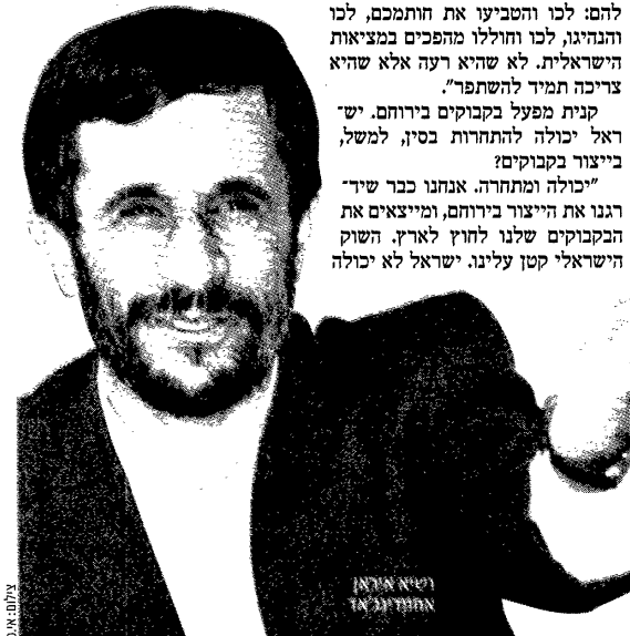
וישא מירא אחרונות

חינם וגאה בכוגריו. ההרשמה למחזוריים הבאים נמשכת. האם אתה, כמי שהרמך מכן למנהיגות נושא את שמו, מודע לעומק משבר המנהיגות בישראל? אני שומע מידיו הישראלים קיטורים על "מנהיגות חלולה", על "מנהיגות ללא חזון הרואגת רק לעצמה", ללא יכווצא באלה. אני מקשיב, אבל לא מסכים. ממש לא. אני מכבד ומוקיר את ההנהגה העכשווית של ישראל, את המרץ והיוזמה שלה. מפרט ספקטיבה של שנותיי ראיתי ופגשתי אינספור פוליטיקאים. הרימתי הציבורי שלהם היה תמיד נמוך, כמעט בלא קשר לכישוריהם וסגולותיהם. הפוליטיקה נחשבת - באמריקה כמו בישראל וכמו בהודיה תהלים עליו לילדיה. מבחינה זו, כמובן כמונו, האמריקאים שום דבר לא יוצא דופן".